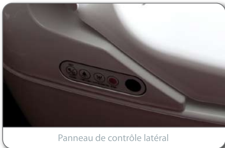
Panneau de contrôle latéral